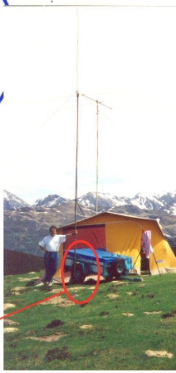
On le voit pas mais c'est ce système qui est sous la roue de la remorque